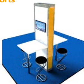
Ausstattung und Farbe variieren je nach Media Port